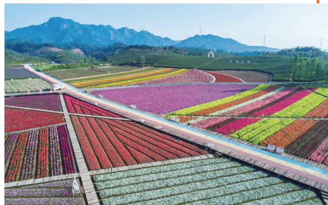
花田小镇